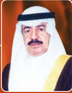
صاحب السمو الملكي الأمير خليفة بن سلمان آل خليفة رئيس الوزراء الموقر حفظه الله ورعاه