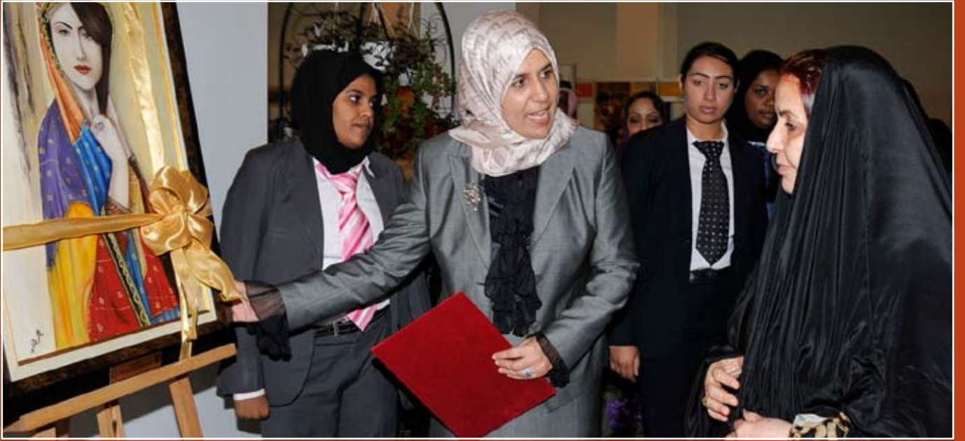
صاحبة السمو الملكي الأميرة سبيكة بنت ابراهيم آل خليفة قرينة ملك مملكة البحرين رئيسة المجلس الأعلى للمرأة خلال افتتاح سموها لمعرض صنع في منزلي ٢٠٠٩