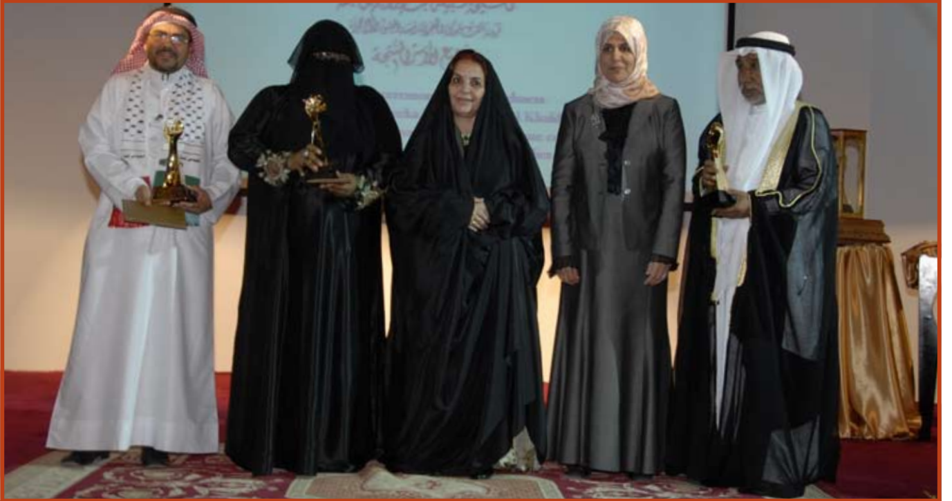
صاحبة السمو الملكي الأميرة سبيكة بنت إبراهيم آل خليفة قرينة ملك مملكة البحرين رئيسة المجلس الأعلى للمرأة مع الفائزين بجائزة سموها لتشجيع الأسر المنتجة ٢٠٠٩