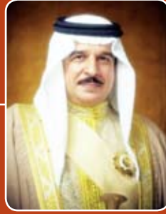
حضرة صاحب الجلالة الملك حمد بن عيسى آل خليفة ملك مملكة البحرين حفظه الله ورعاه