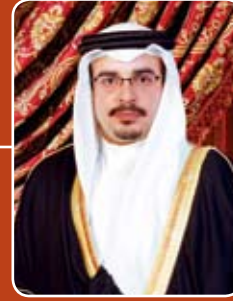
صاحب السمو الملكي الأمير سلمان بن حمد آل خليفة ولي العهد نائب القائد الأعلى حفظه الله ورعاه