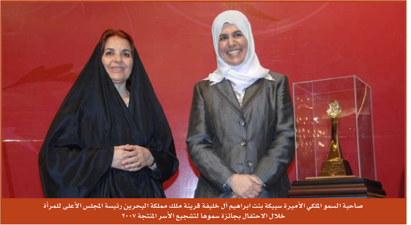
صاحبة السمو الملكي الأميرة سبيكة بنت إبراهيم آل خليفة قرينة ملك مملكة البحرين رئيسة المجلس الأعلى للمرأة خلال الاحتفال بجائزة سموها لتشجيع الأسر المنتجة ٢٠٠٧