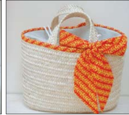
٦- حقائب نسائية مطورة من السعف والقماش