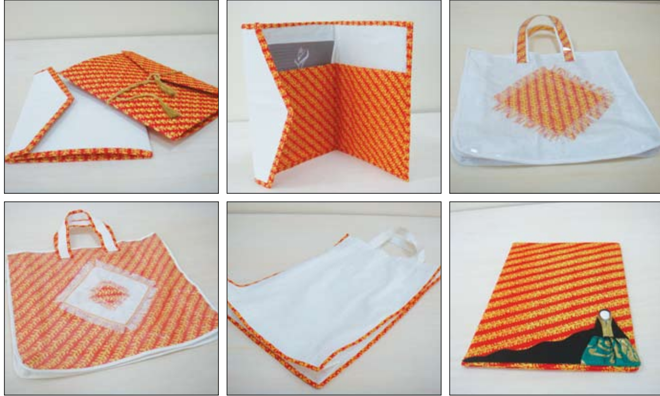
٨- منتجات خاصة بحفل جائزة صاحبة السمو الملكي الأميرة سبيكة بنت إبراهيم آل خليفة