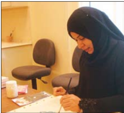
١٤- مخدات خاصة لغرفة جلوس رسمت يدوياً على الحرير الطبيعي