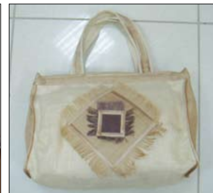
٩- حقائب من خام الخيش