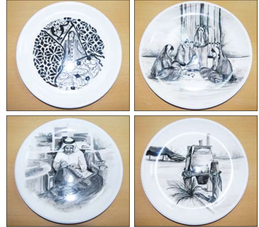
١٨- صحون من الفخار الأبيض رسم عليها بألوان تحت الطلاء، ثم زججت بالطلاء الشفاف