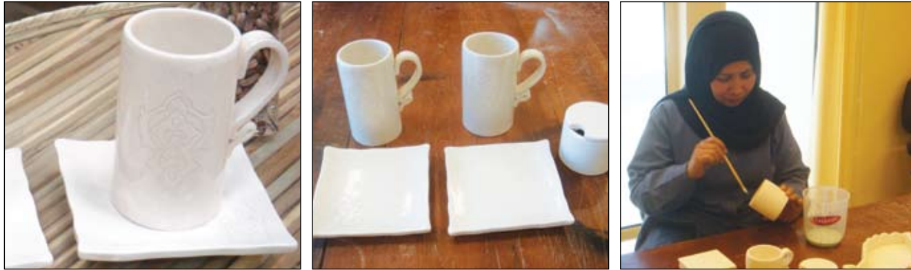
١ - أواني خزفية خاصة بمائدة طعام

صور لبعض أعمال مركز التصميم والابتكار التي تم تطويرها وإنتاجها خصيصاً لمعرض جائزة صاحبة السمو الملكي الأميرة سبيكة بنت إبراهيم آل خليفة لتشجيع الأسر المنتجة