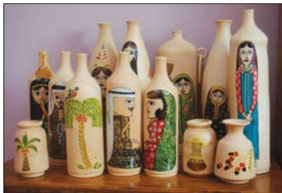
١٢- جرار فخارية رسم عليها بألوان الزجاج من اعمال مركز التصميم والابتكار