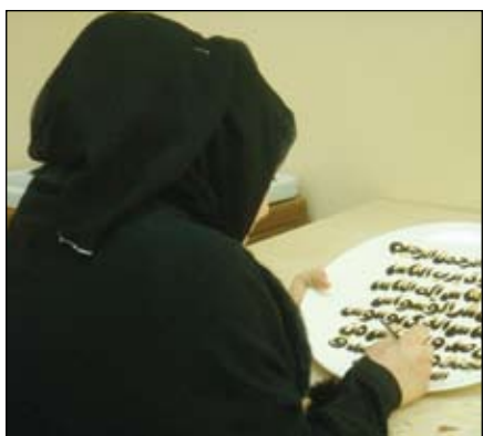
١٥- الرسم على البورسلين والزجاج