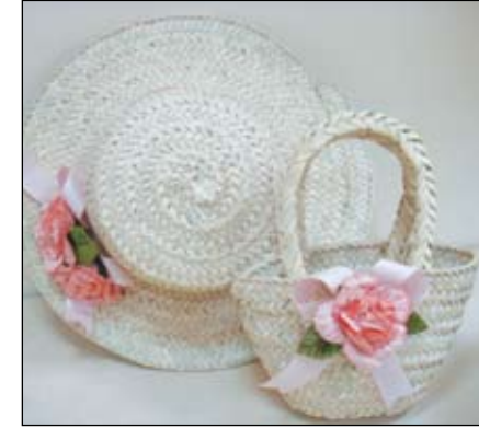
٧- قبعة طفلة مع حقيبة مصنعة من السعف الأبيض