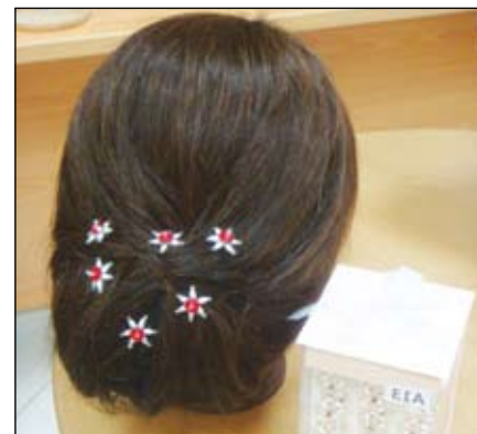
١١- إكسسوار شعري نسائي خاص بالمناسبات