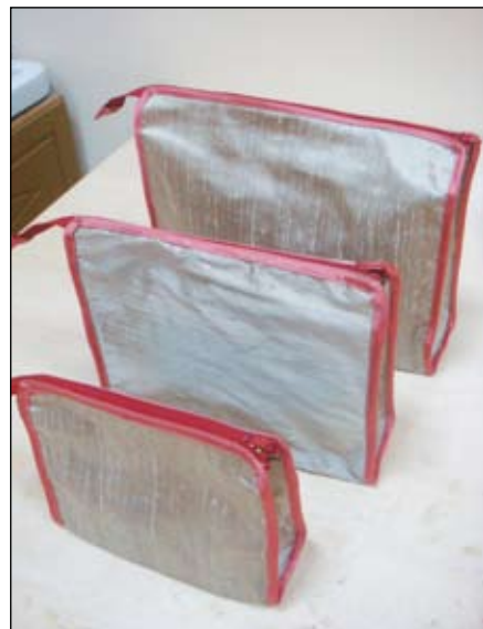
١٠- حقائب نسائية لاستخدامات متعددة من الحرير الطبيعي