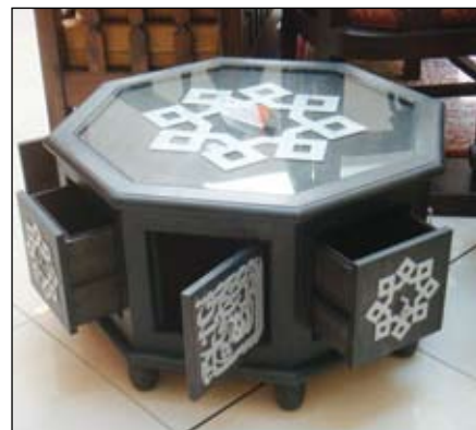
١٥- طاولة تقديم ثمانية الأضلع من الخشب تم طلاؤها بلون مطفي مع إضافة بعض الزخارف والخطوط العربية