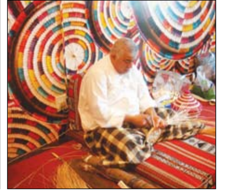
٤- سبائك من السعف الأبيض والملون مطورة خاصة للتقديم