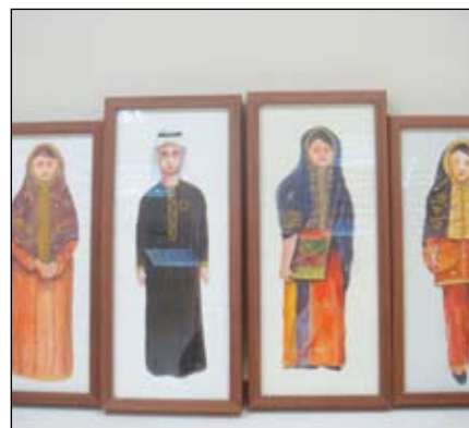
١٣- لوحات رسمت يدوياً على قماش بألوان أكريليك