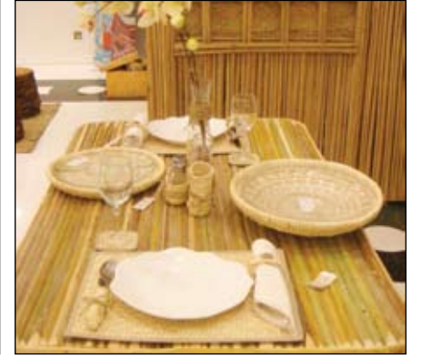
٢- طقم سفرة مصنوع من السعف الأبيض