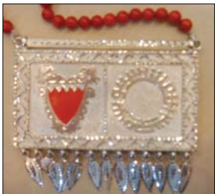
١٧- مصوغات من الفضة