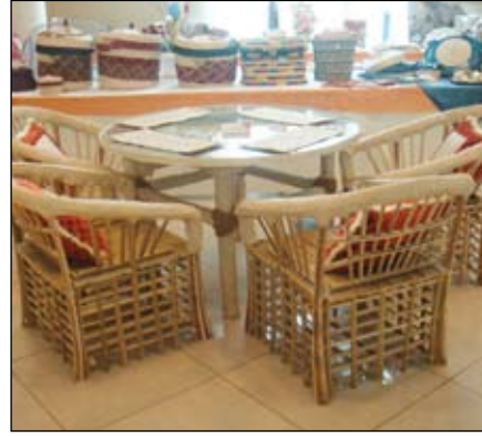
٣- طاولة طعام مع أربعة كراسي من جريد النخلة والسعف الأبيض