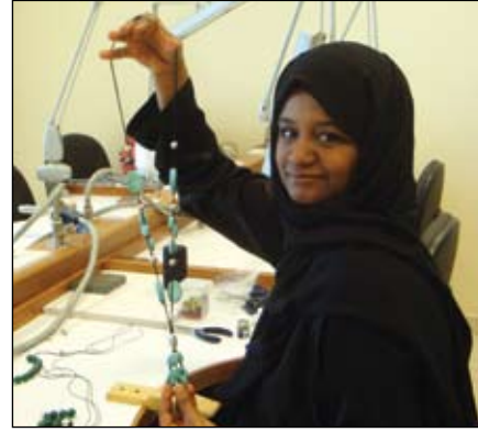
٥- أكسسوار نسائي / ميداليات من السعف وأحجار الكريستال من اعمال فئة ذوي الاحتياجات الخاصة ومن الأسر المنتجة