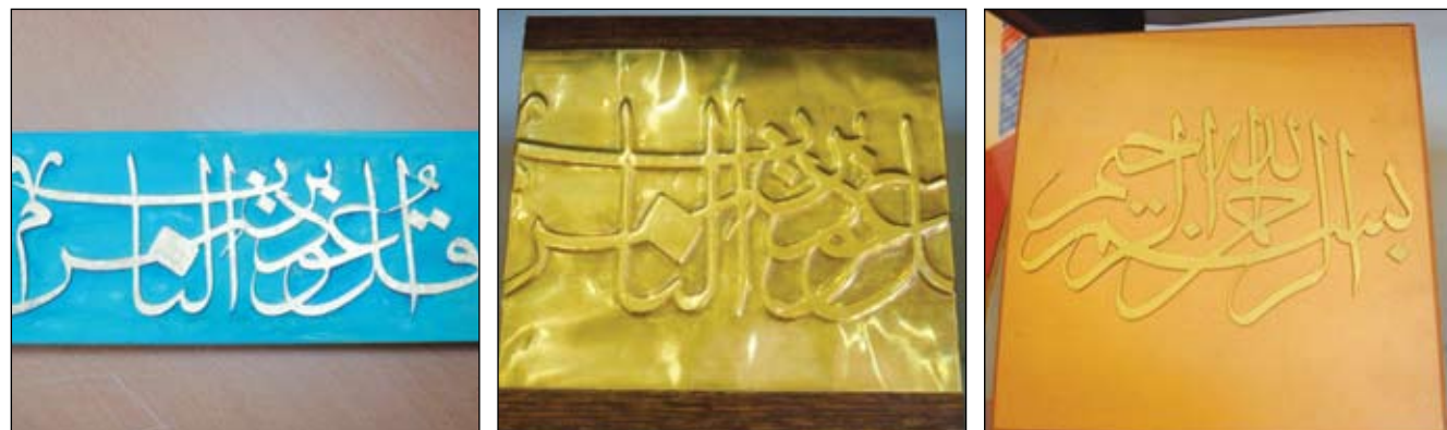
١٦- لوحات محفورة على الخشب تشكيل على المعدن